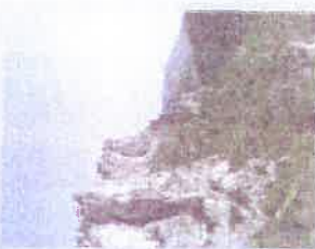
Les espèces et les habitats des zones rocheuses

80 % du site compris sur la ZPS-Directive Oiseaux « Hautes garrigues du Montpelliérain »