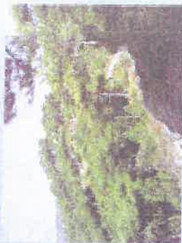
La forêt de pins de Salzmänn