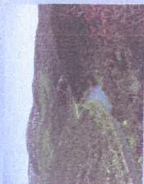
Les espèces et les habitats liés à l'Hérault