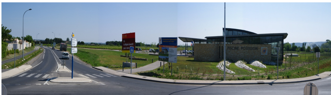
vue n° 3

Sur le tronçon de RD5 entre le sud de Cournonterral et la piscine Poséidon, les perceptions sur la zone de projet sont entièrement masquées.