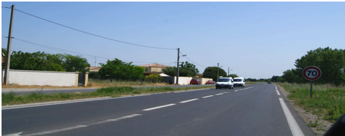
vue n° 1