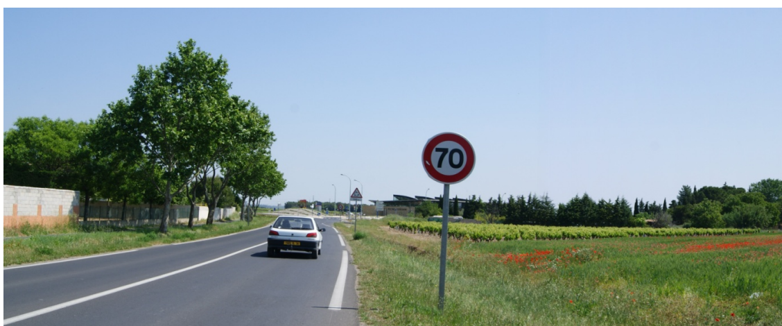
vue n° 2

Sur le tronçon de RD5 entre le sud de Cournonterral et la piscine Poséidon, les perceptions sur la zone de projet sont entièrement masquées.