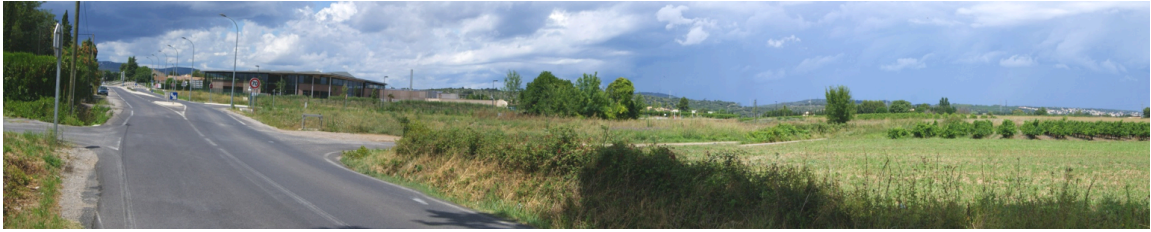
vue n° 7 depuis la RD114 au sud

Depuis cette départementale menant à Saint-Jean-de-Védas, les perceptions sont ouvertes sur la piscine POSÉIDON et les cultures de la zone de projet. Les reliefs de la montagne de la Moure et du causse d'Aumelas constituent la ligne directrice de ce paysage à dominante agricole.