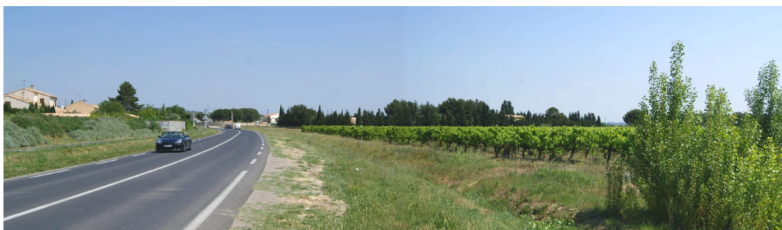
vue n° 4

Depuis le rond-point d'accès à la piscine, les perceptions sont dégagées sur le secteur ouest de la zone de projet.