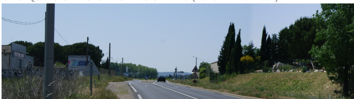
vue n° 5

Depuis la RD5, les perceptions latérales sont ouvertes sur les parcelles de vignes et sur la zone d'habitat au nord.