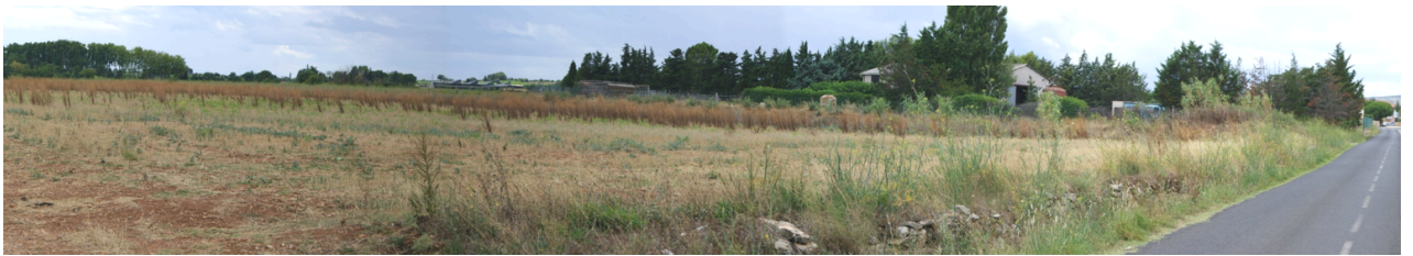
vue n° 8 depuis la RD185 au nord

Depuis cette départementale menant à Saint-Jean-de-Védas, les perceptions sont ouvertes sur la piscine POSÉIDON et les cultures de la zone de projet. Les reliefs de la montagne de la Moure et du causse d'Aumelas constituent la ligne directrice de ce paysage à dominante agricole.