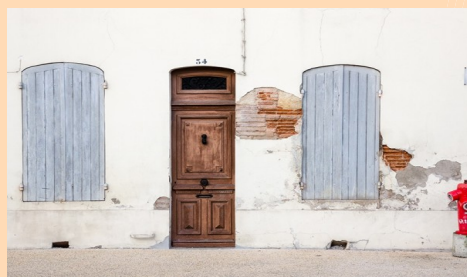
Méconnaissance des produits : l'enduit ciment n'est pas adapté à ce mur ancien.