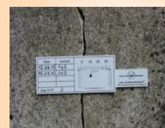
Fissure dans mur porteur.

▶ On note ainsi en moyenne de 150.000 à 160.000 sinistres déclarés annuellement dans la construction en Responsabilité Civile Décennale et de 130.000 à 140.000 en Dommage Ouvrage et en police unique de chantier. (voir fiche 105)