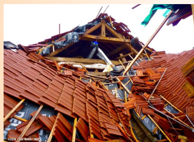
Rupture brutale de panne faitière par défaut de calcul.