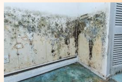
Mauvaise mise en œuvre : infiltration d'eau, moisissures sur le doublage.