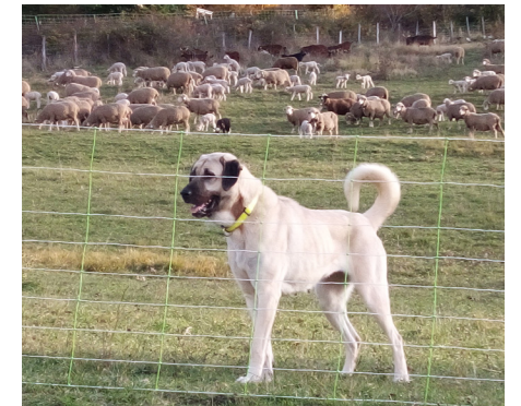
Berger d'Anatolie

Le chien de protection est autonome : il accompagne son troupeau et veille sur lui sans relâche, nuit et jour même quand l'éleveur ou le berger n'est pas là. Pour exercer sa vigilance, il crée une zone de protection autour du troupeau, se tenant prêt à éloigner tout intrus : chien non tenu en laisse, promeneur, animal sauvage, etc. Ne le confondez pas avec le chien de conduite qui, lui, sert à diriger ou à rassembler le troupeau et qui accompagne le berger.