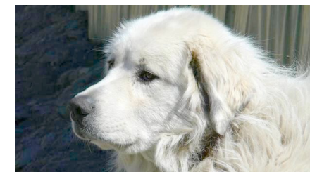
Pyrenean Mountain Dog

Born inside the fold, the pup forges strong bonds with the sheep: their relationship is up to a total and mutual acceptance. After which the livestock guarding dog lives permanently in the flock: summer over the pasture and winter inside the fold. These links condition the livestock guarding dog to react instinctively to any intrusion against the flock.