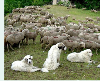
Montagnes des Pyrénées appelés patous

L'irruption de tout élément étranger au troupeau (chien non tenu en laisse, promeneur, VTT...) peut perturber la bonne marche du troupeau et le travail du berger : elle met le chien de protection en alerte. À votre approche, le chien de protection vient vous flairer pour vous identifier. Après quoi, il regagne son troupeau. Parfois, il peut tenter de vous intimider en aboyant.