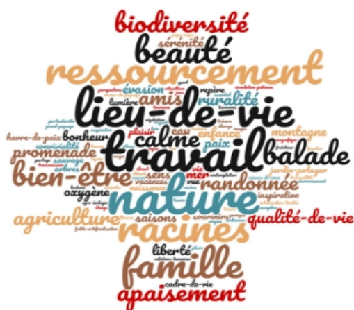
Nuage de mots suite à une enquête de 2019 sur les valeurs paysagères

Si la plupart des départements bénéficient actuellement d'un atlas départemental des paysages, ce transfert de compétence de l'État vers les collectivités ne s'est pas toujours accompagné d'une prise en main de l'outil, souvent par méconnaissance de celui-ci et peut-être parfois du fait d'une inadaptation apparente aux besoins en matière de politiques publiques. Alors que le paysage est englobant et fédérateur ... En Occitanie, mis à part les atlas des Hautes-Pyrénées et de la Haute-