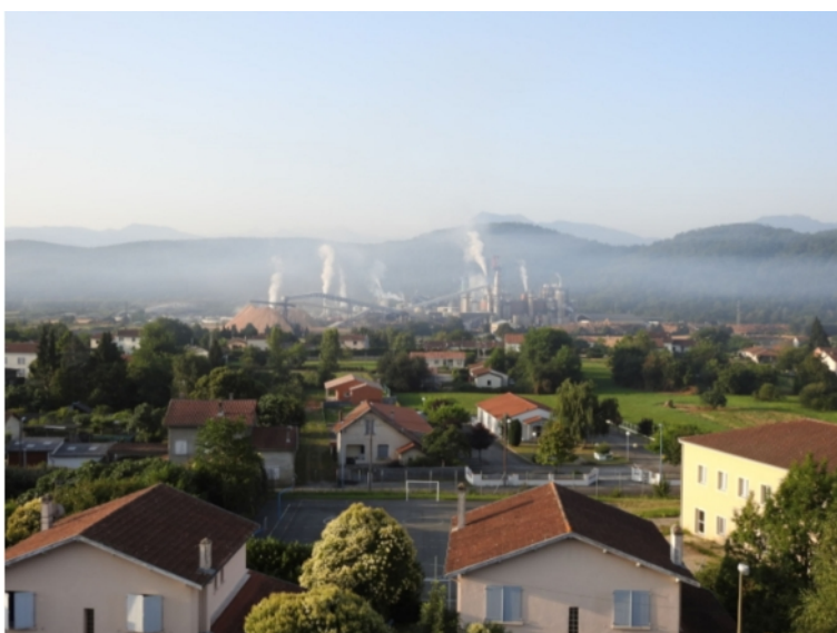
Paysage composite autour de Saint-Gaudens (31) alliant montagne, péri-urbain et industries