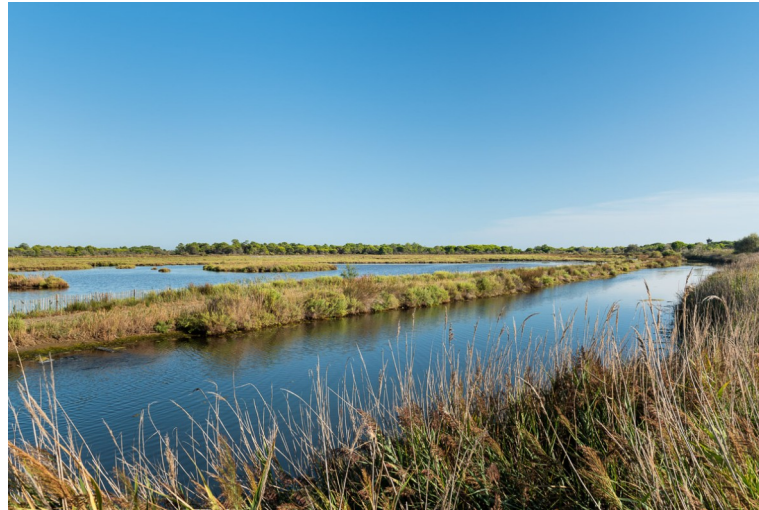
Les paysages naturels emblématiques