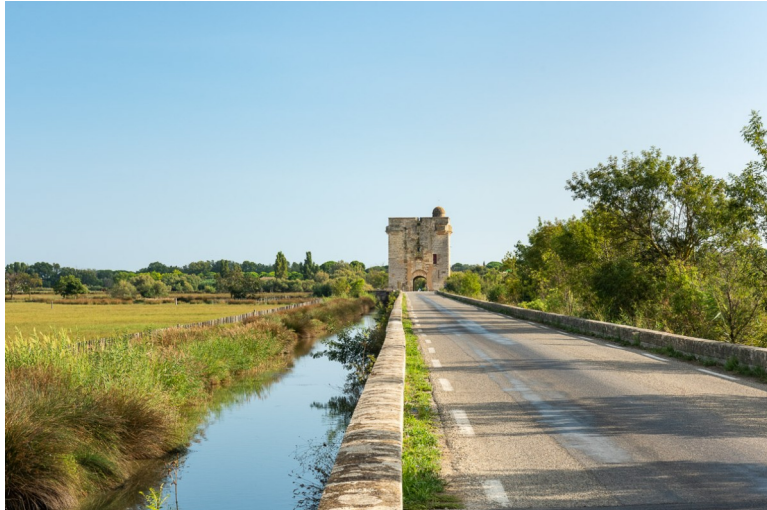
Les sites classés