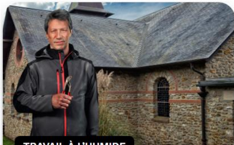
TRAVAIL À L'HUMIDE

Intervenez en sécurité : Règles de l'art Amiante - sous-section 4 ( reglesdelartamiante.fr )