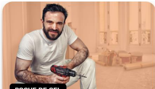
POCHE DE GEL

Démontage de quelques ardoises amiante ciment sur charpente bois [extérieur]