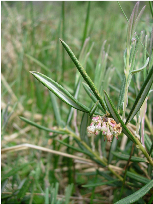
Andromède ( Andromeda polifolia ) M. Kleszczewski