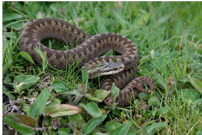
Vipère péliade ( Vipera berus ) - X. Rufroy