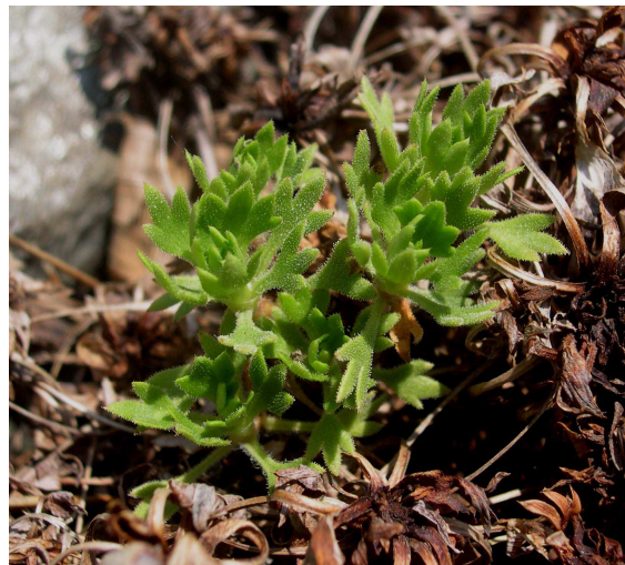
Saxifrage de Prost ( Saxifraga pedemontana subsp. prostii ) M. Kleszczewski