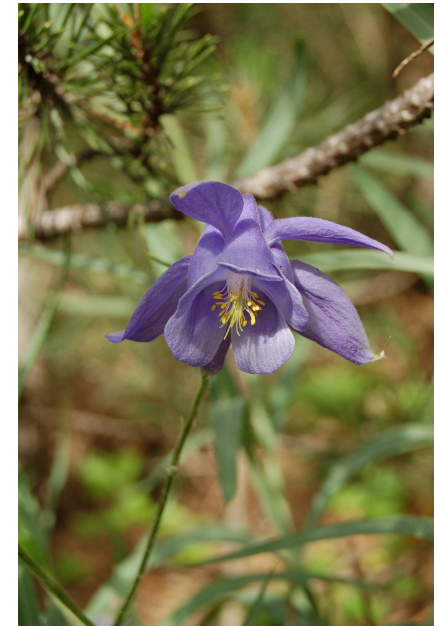
Andromède ( Aquilegia viscosa ssp viscosa ) B. Gomez