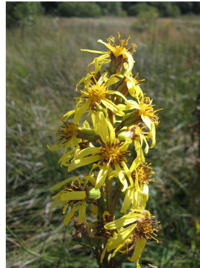
Ligulaire de Sibérie ( Ligularia sibirica ) M. Kleszczewski