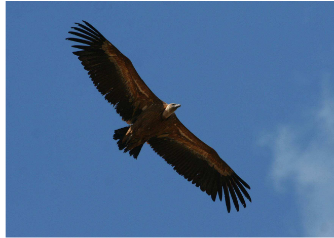
Vautour fauve ( Gyps fulvus ) - X. Rufroy