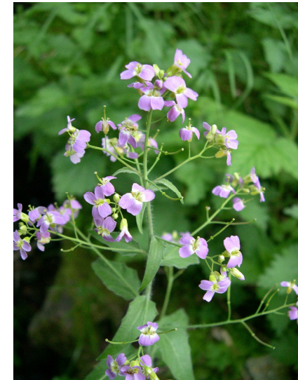
Arabette des Cévennes ( Arabis cebennensis ) M. Kleszczewski