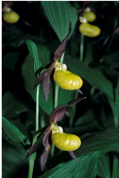
Sabot de Vénus ( Cypripedium calceolus ) T. Gendre