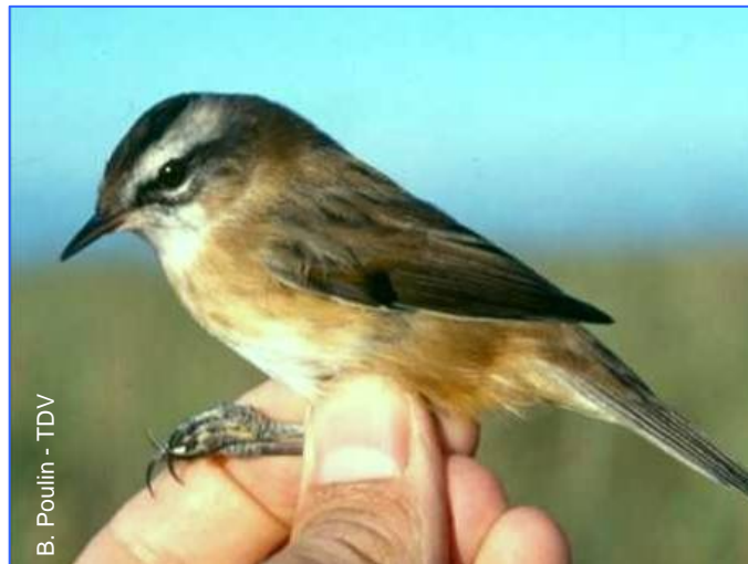
B. Poulin - TDV