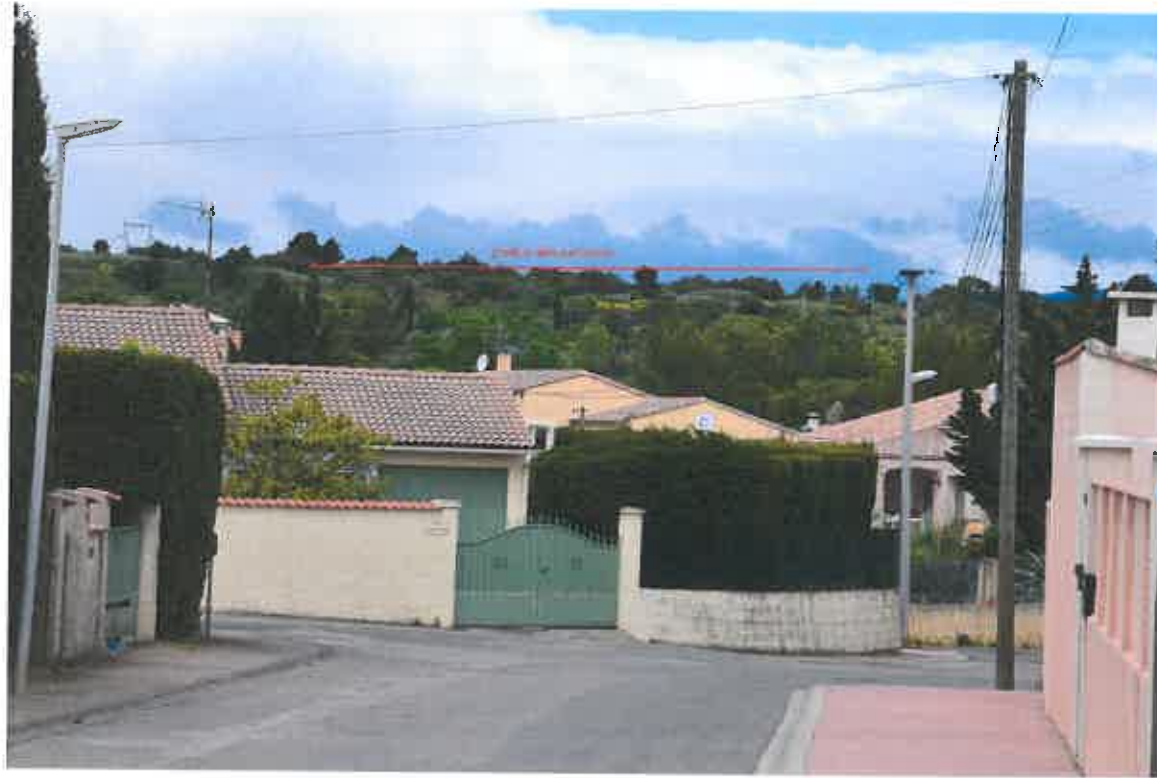
VUE DEPUIS LE LOTISSEMENT AVANT PROJET