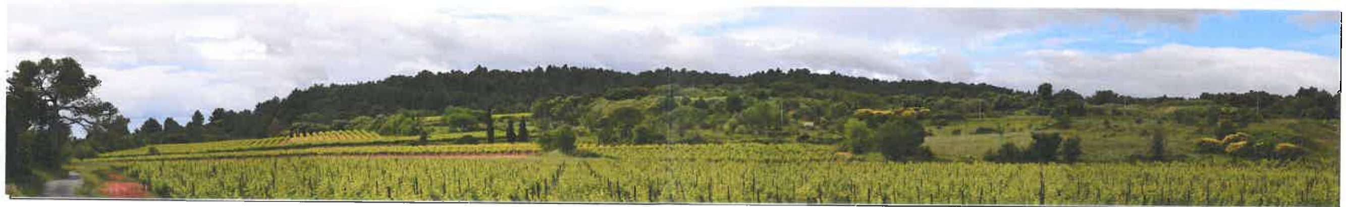
VUE DEPUIS LA VALLEE SITUEE AU SUD DU TERRAIN