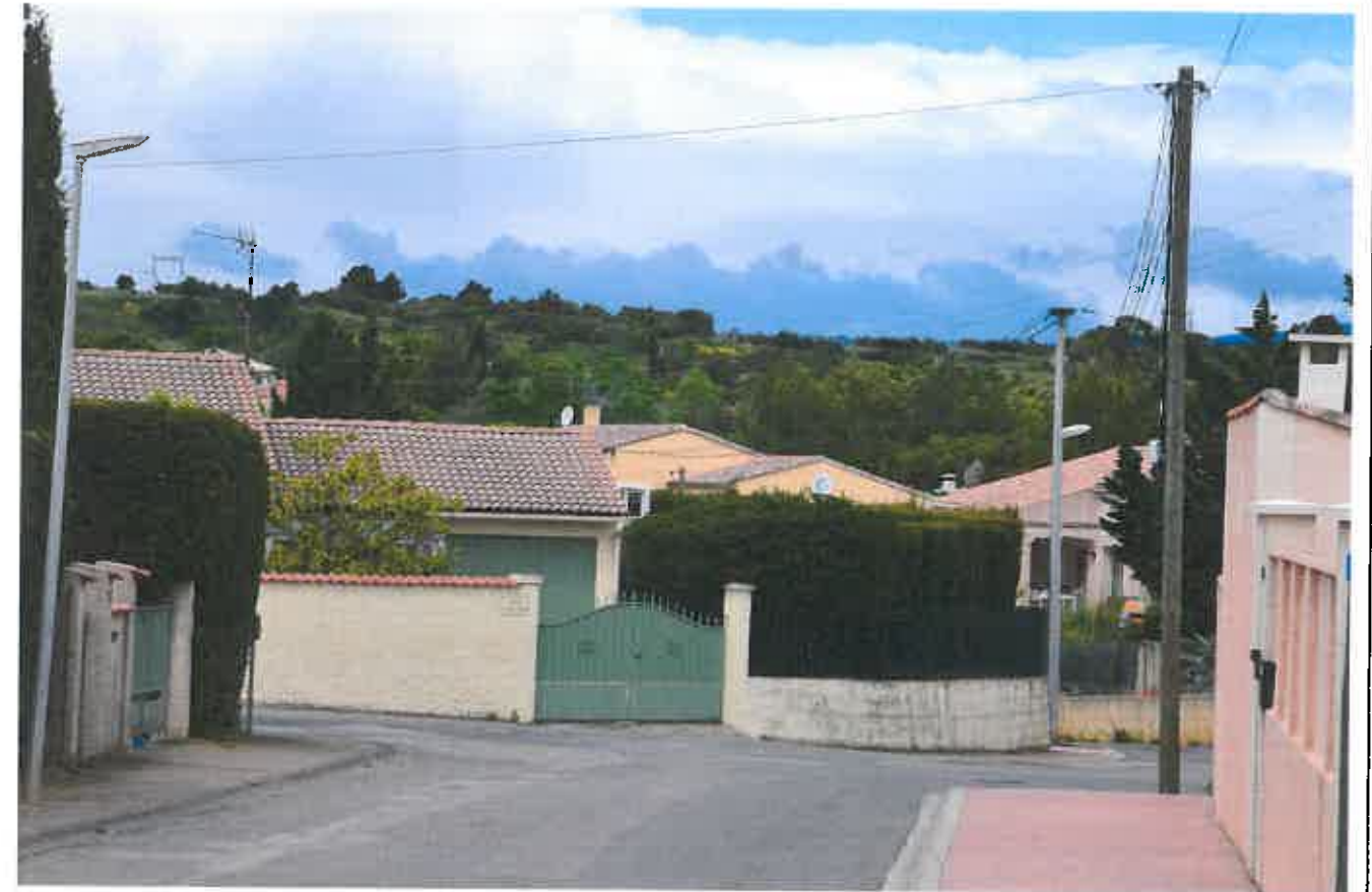
VUE DEPUIS LE LOTISSEMENT APRES PROJET