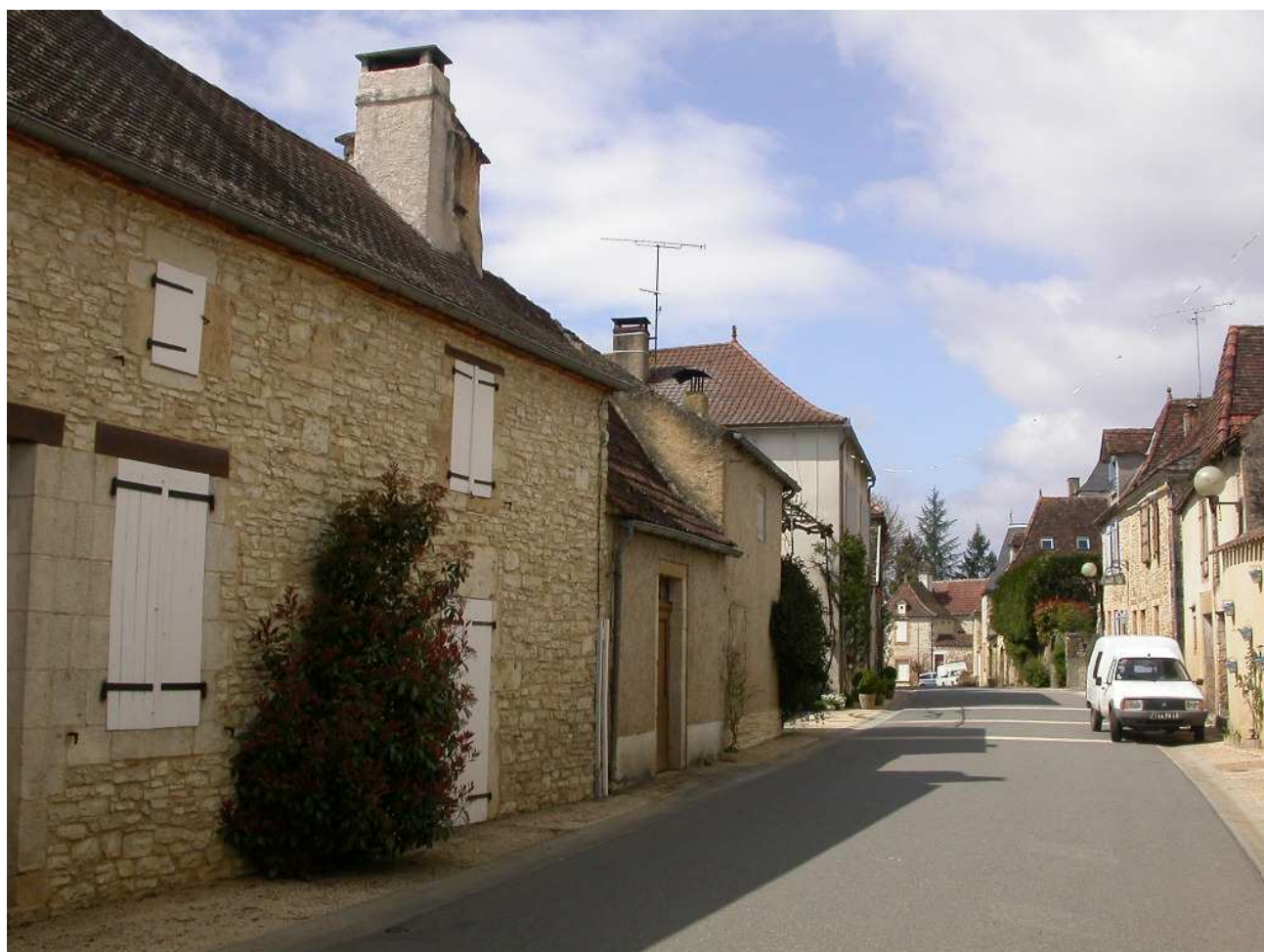
Une rue typique de la Bouriane