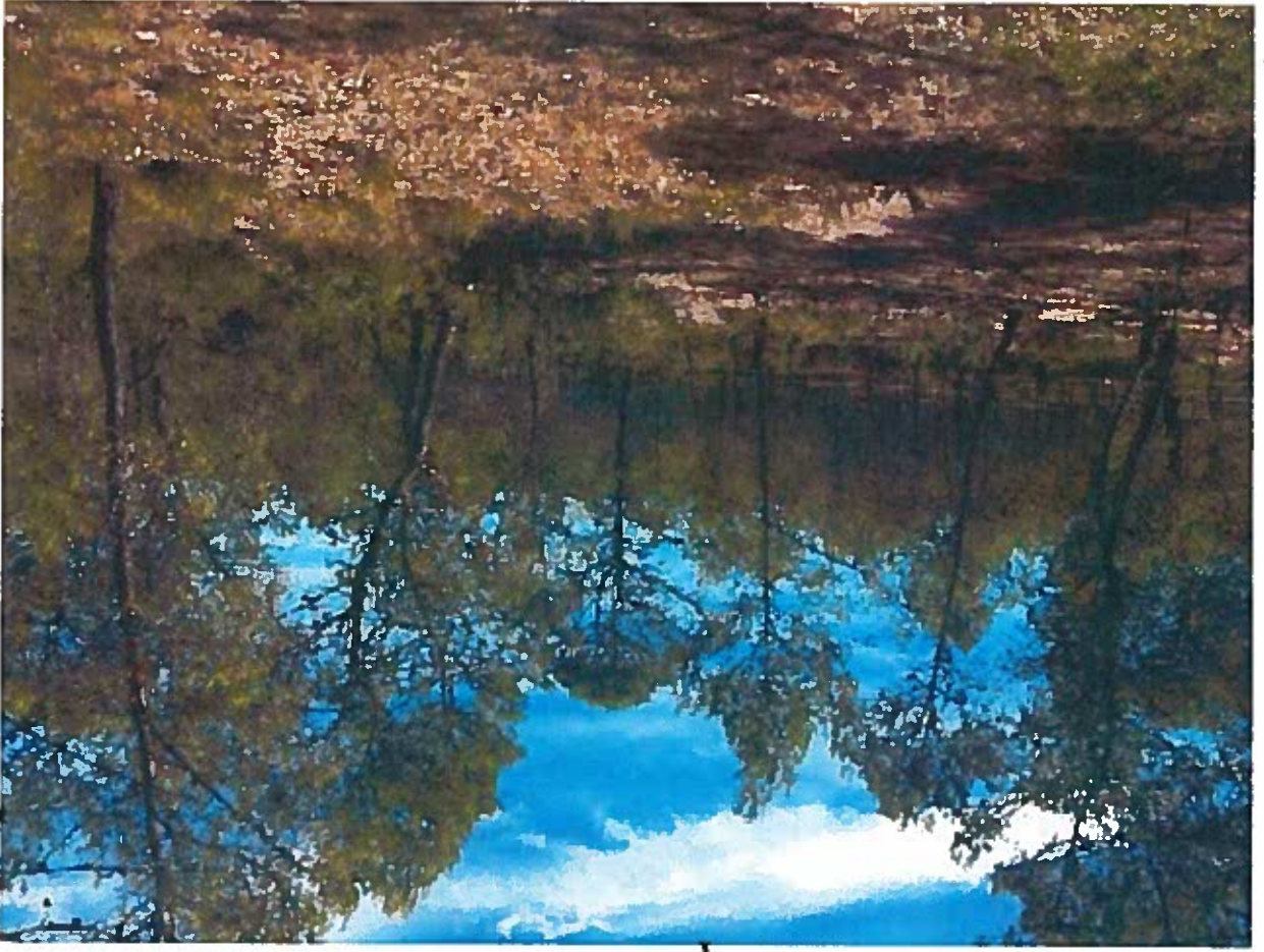
B 97 : Vue Sud projet défriche