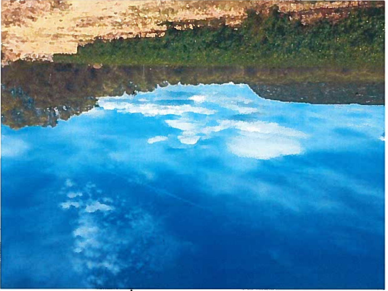
B 96 : Vue Massif projet défriche