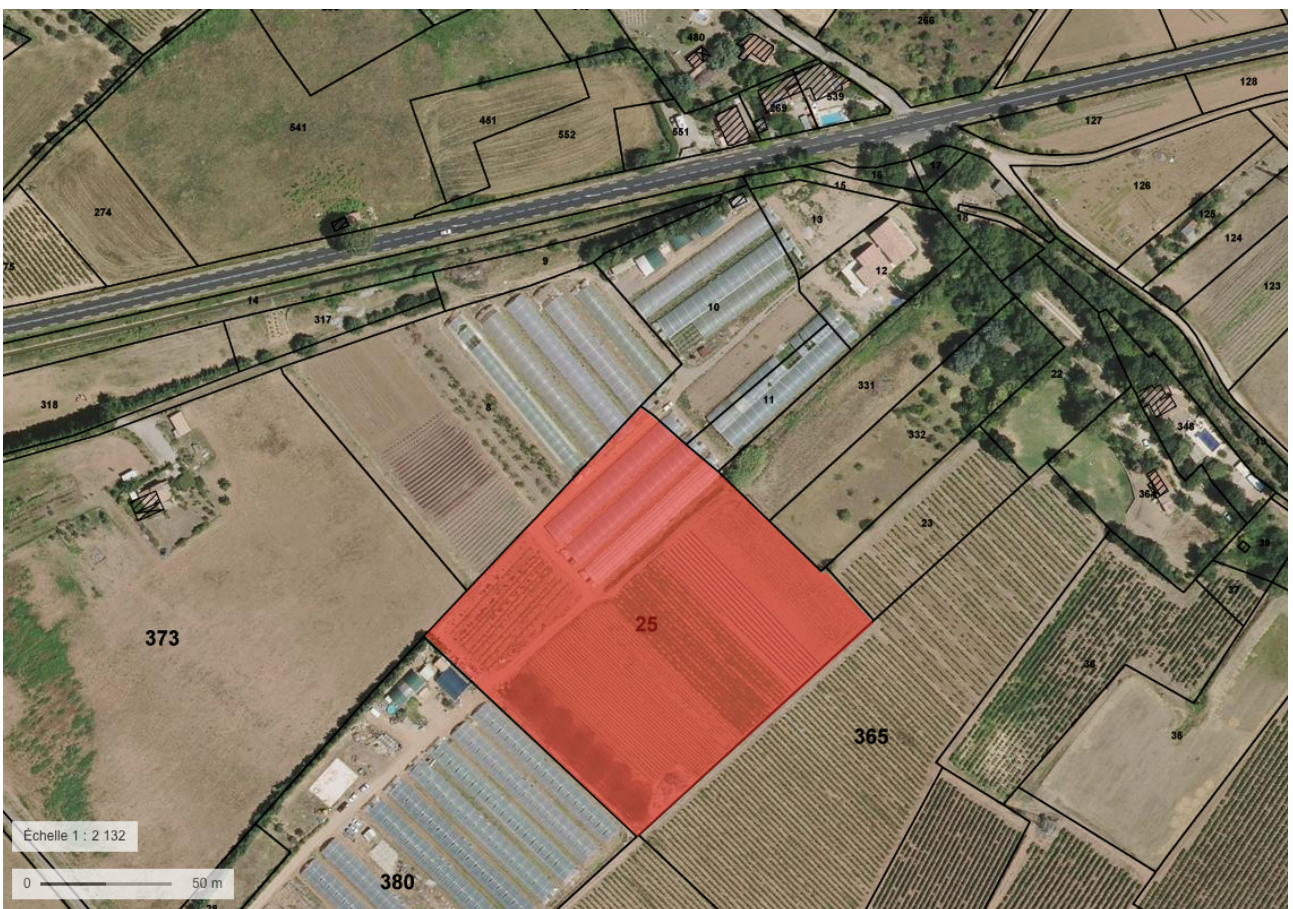
Localisation de la parcelle-projet sur photo aérienne