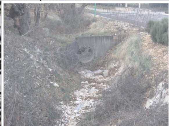
Cours d'eau en amont immédiat de l'ancienne RD 986