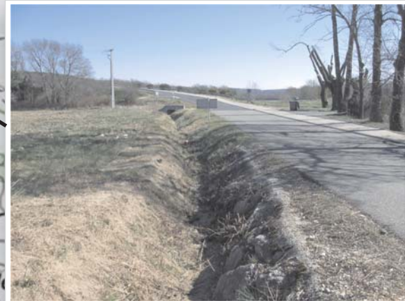
Cours d'eau à l'aval de l'opération, busé au niveau du franchissement de la déviation