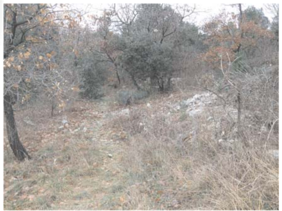
Cours d'eau - Lit non marqué en garrigues