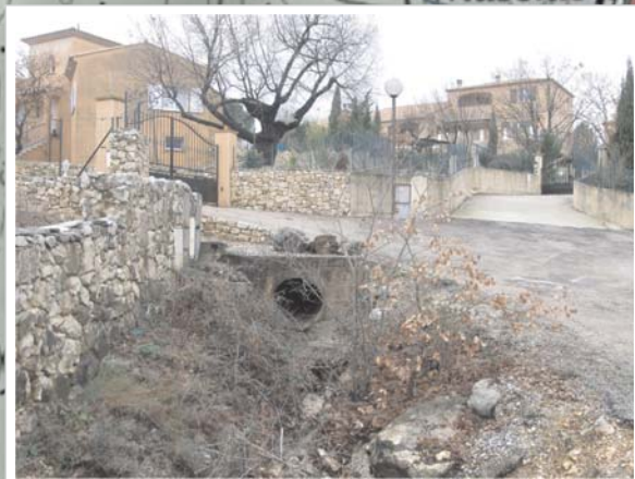
Cours d'eau à la sortie de la section canalisée sous le lotissement des Garrigues et longeant l'allée de Costebelle