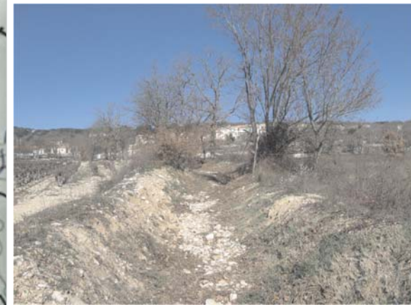
Cours d'eau "perché et endigué" dans la traversée de l'opération