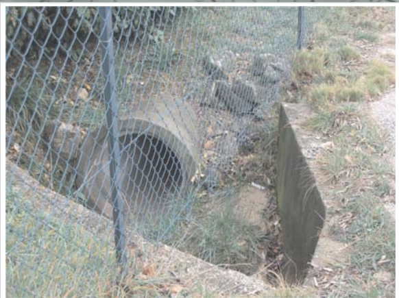
Fossé busé le long de la RD 122 dans la traversée du PA des Hautes Garrigues alimentant le cours d'eau