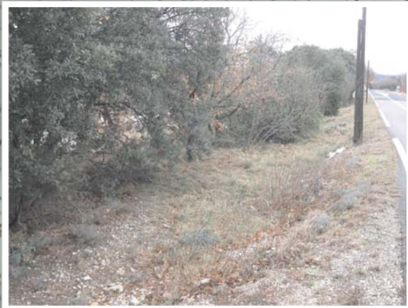
Talweg le long de la RD122