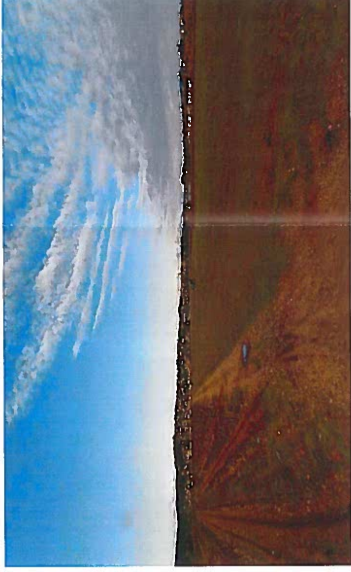
Photo 1 : Vue du projet en direction du Nord depuis un chemin agricole