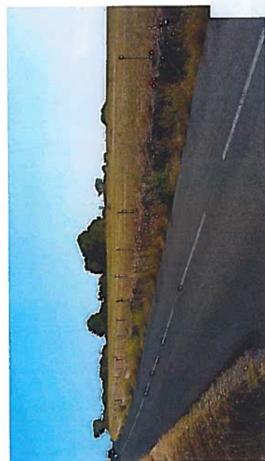
Photo 4 : Vue du projet et bosquet en limite d'opération en direction du Sud(ouest depuis la RD5e2