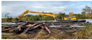
Contributions de coupe en bois NM 0427 - 32 Rue Notre Dame - 31370 RIEUMAJOU - ☎ 05 62 28 80 00 Courriel : contact@nmgp.org Site : www.nmgp.org