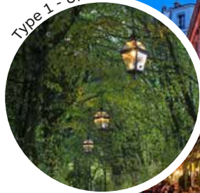
Type 1 - Urbain