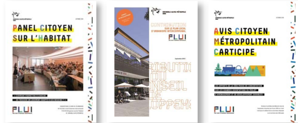
Exemples de couvertures de documents de restitution extraits du diaporama « La concertation du PLUI Grenoble-Alpes Métropole »

« Un temps fort de restitution s'est déroulé dans un format plus classique de type réunion publique, capitalisant l'ensemble des apports de cette première phase de diagnostic. L'animation a néanmoins été pensée avec attention, les conclusions ont été exposées en convoquant un décalage sémantique et de l'humour, pour ne pas sombrer dans l'exposé technique et fastidieux : la forme du territoire faisant penser à la silhouette d'un chiot, la présentation a été déclinée comme la morphologie de l'animal avec des illustrations clin d'œil (son pedigree : le paysage, son système sanguin : ses routes, ses principaux organes...). »