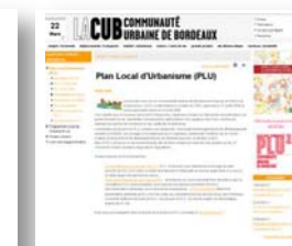
Dossier consacré au PLUi sur le site internet de la CUBle