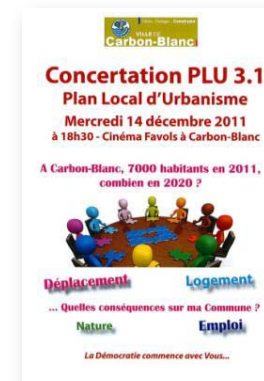
Dépliant envoyé aux habitants

Des dépliants ont également été diffusés dans les boîtes à lettres, pour inviter les habitants aux forums et aux réunions publiques.