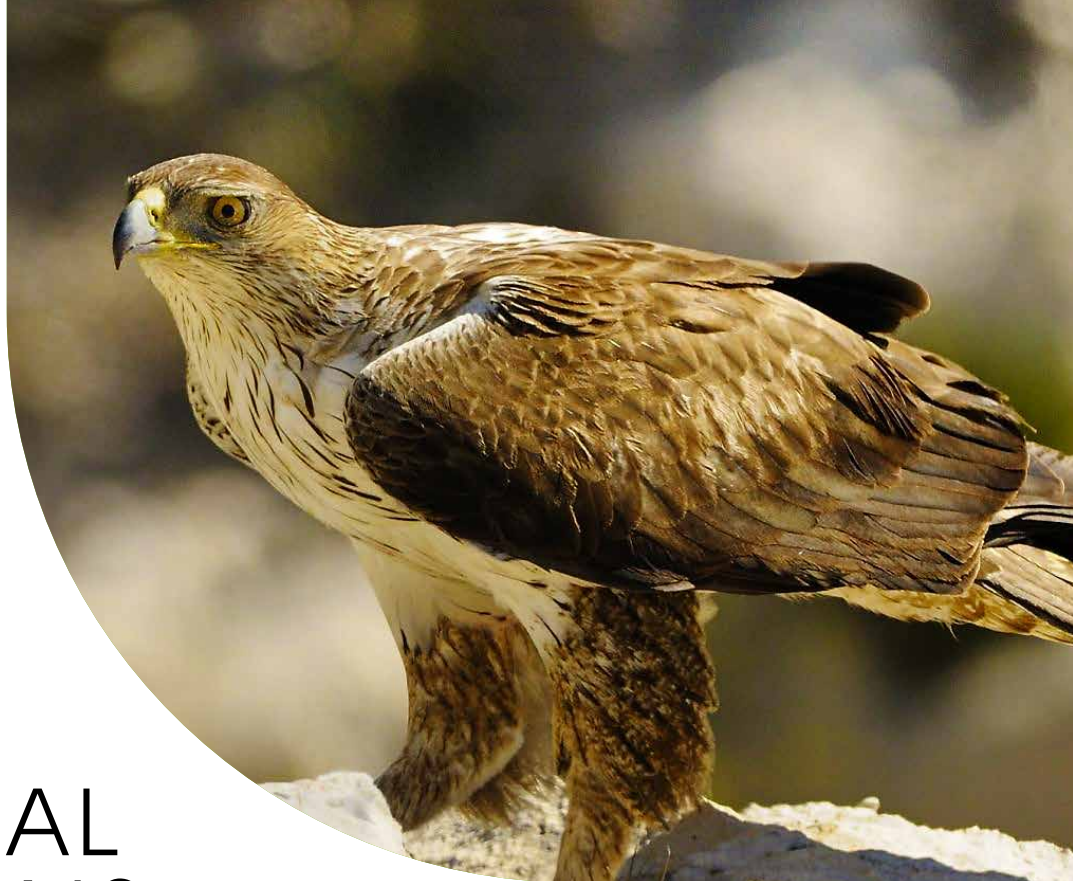
Aigle de Bonelli (Aquila fasciata) Jean-Claude Tempier - CEN-PACA