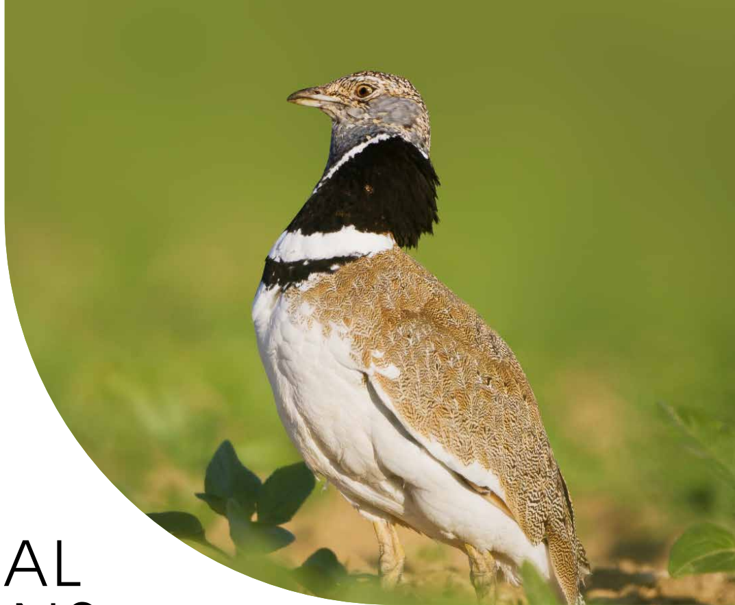
Outarde canepetière ( Tetrax tetrax ) Jean-Luc Pinaud