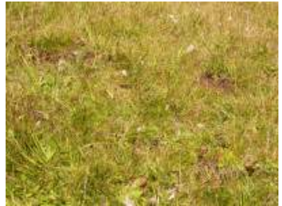
Bas marais alcalins