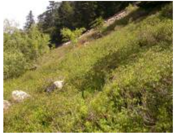
Landes à Rhododendron

Rhododendro ferruginei - Vaccinio myrtilli