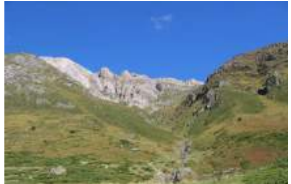
Landes à genévrier

Rattachement phytosociologique encore imprécis