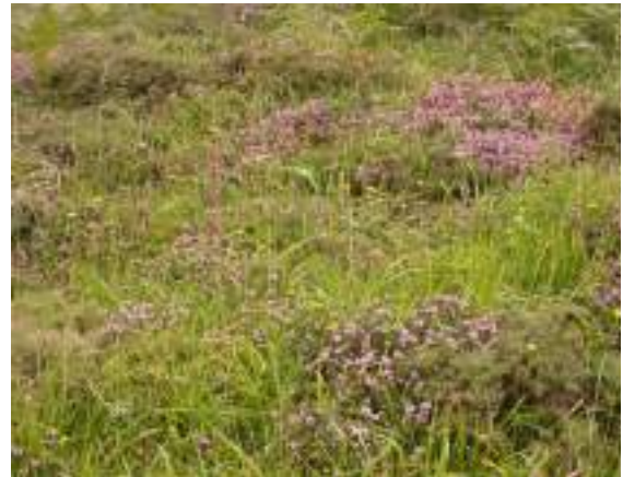
Lande subatlantique