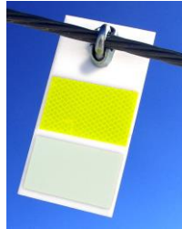
Modèle fixe 26 € pièce