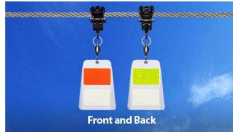
Modèle pivotant 45 € pièce