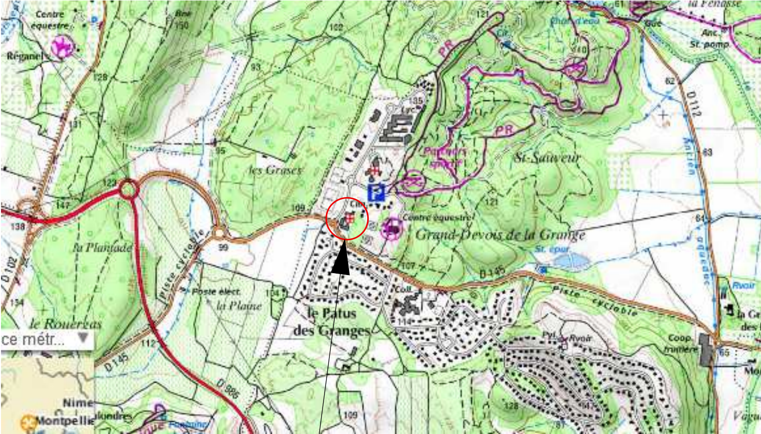
EXTRAIT DE LA CARTE IGN Ech. : 1/25 000