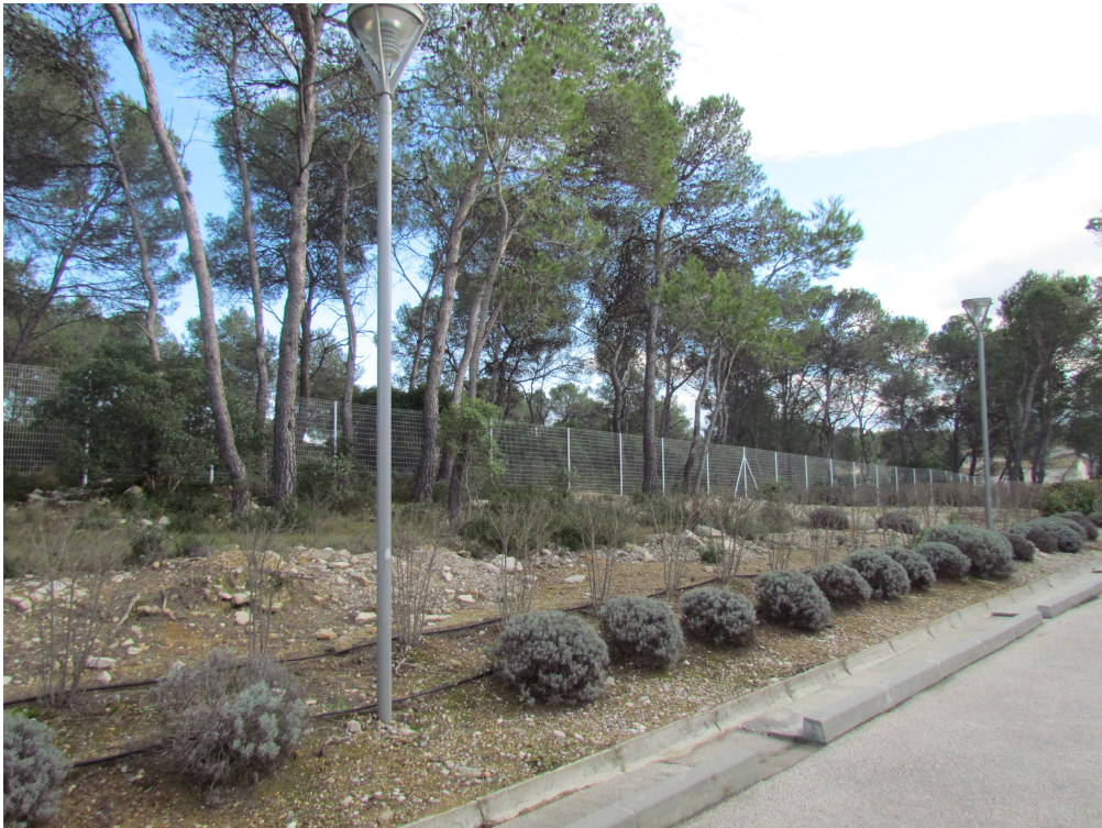
HOSPITALISATION DE JOUR, VUE PROCHE, VUE 1