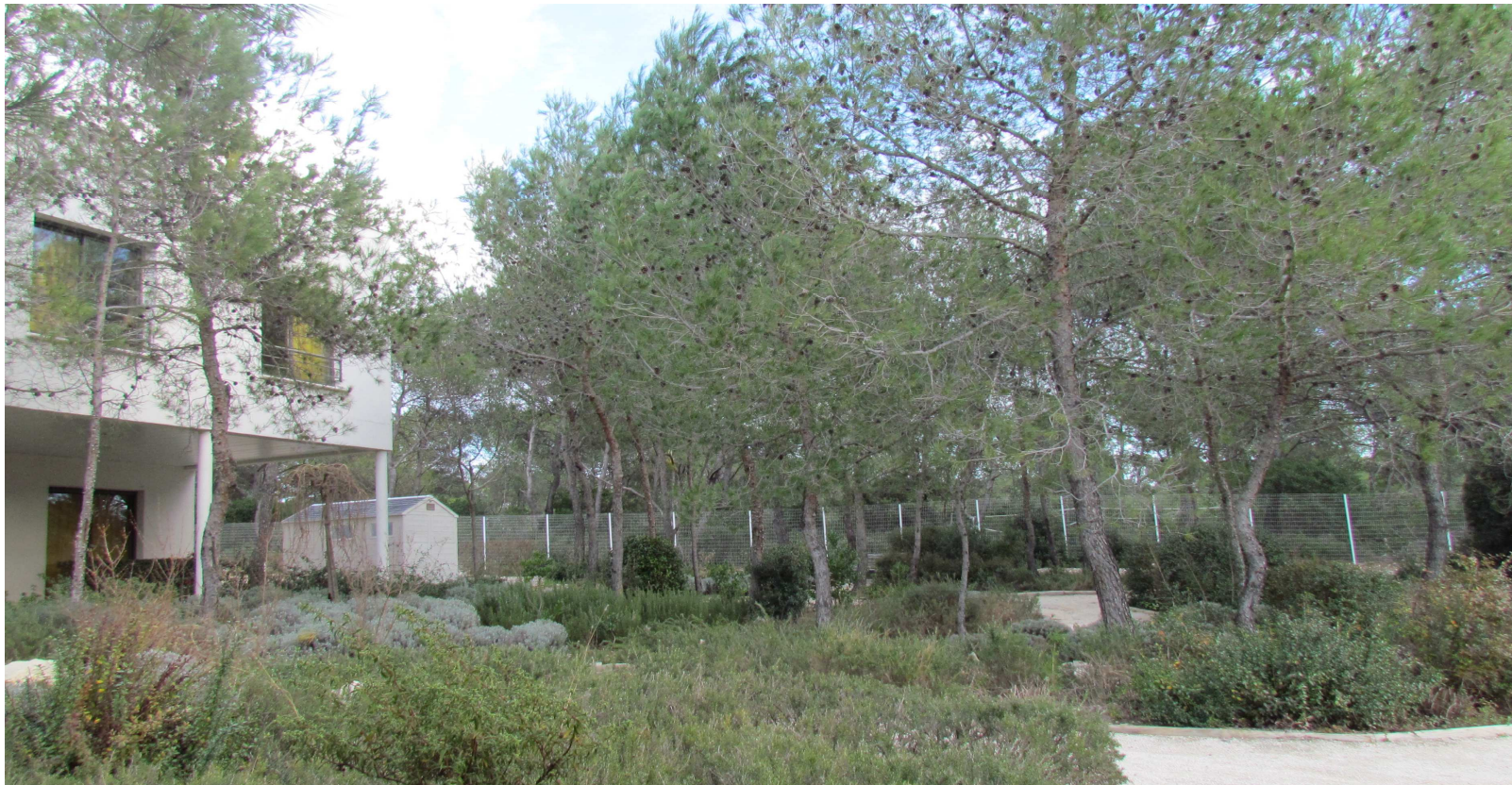
6 CHAMBRES DOUBLES, VUE PROCHE, VUE 1