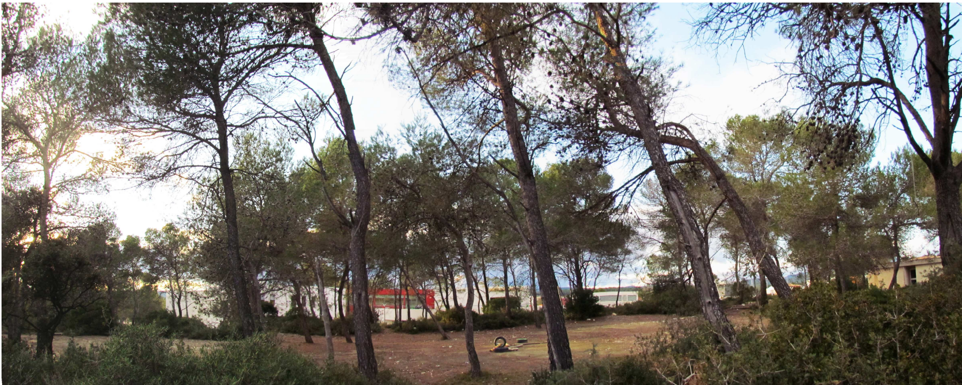
HOSPITALISATION DE JOUR, VUE LOINTAINE, VUE 2