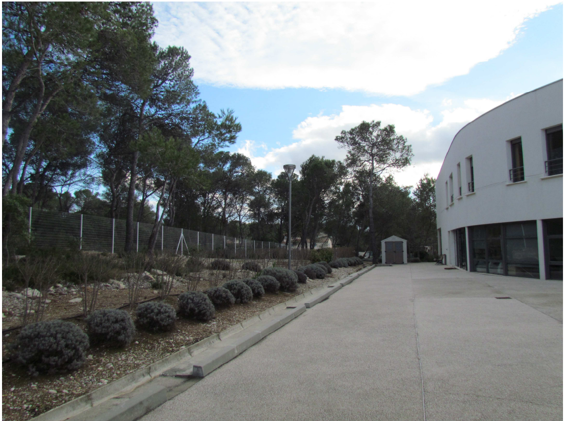
6 CHAMBRES DOUBLES, VUE LOINTAINE, VUE 2