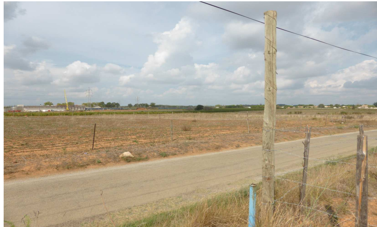
4. Vue du nord depuis la zone projet – chantier LGV et A9