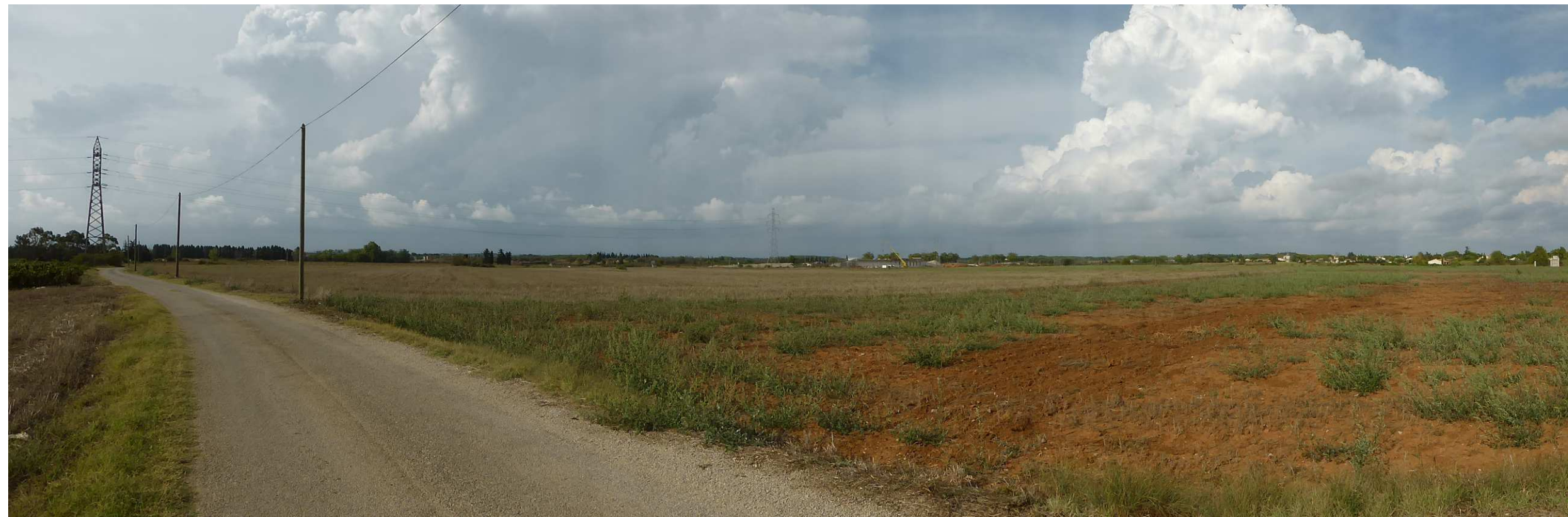
2. Vue d'ensemble de la zone projet