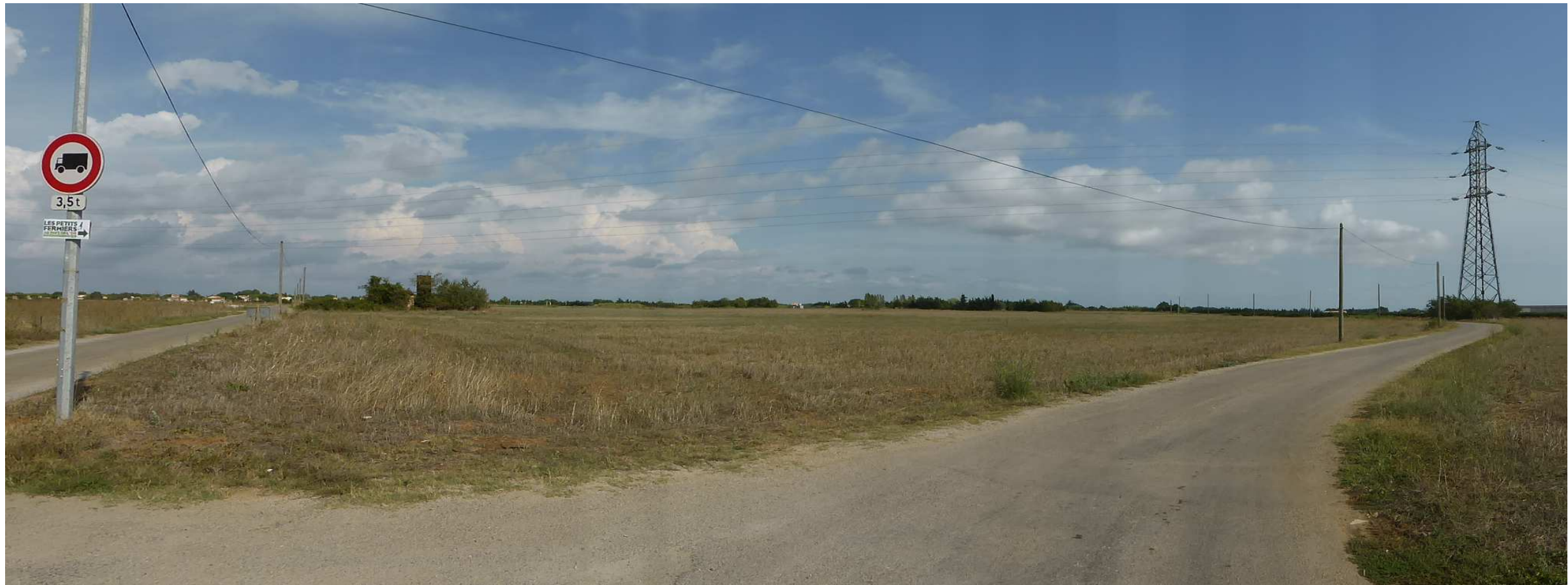
1. Vue d'ensemble de la zone projet depuis le nord-ouest les parcelles sont bordées par des terres agricoles et traversées par une ligne HT (limite de l'emprise prise en compte pour le dimensionnement du projet)