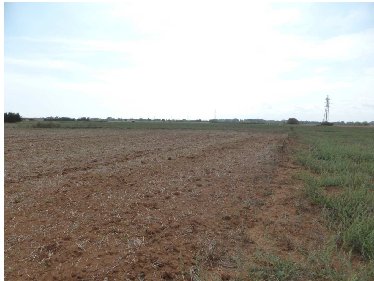
3. Parcelles cultivées en limite du projet à l'ouest du projet