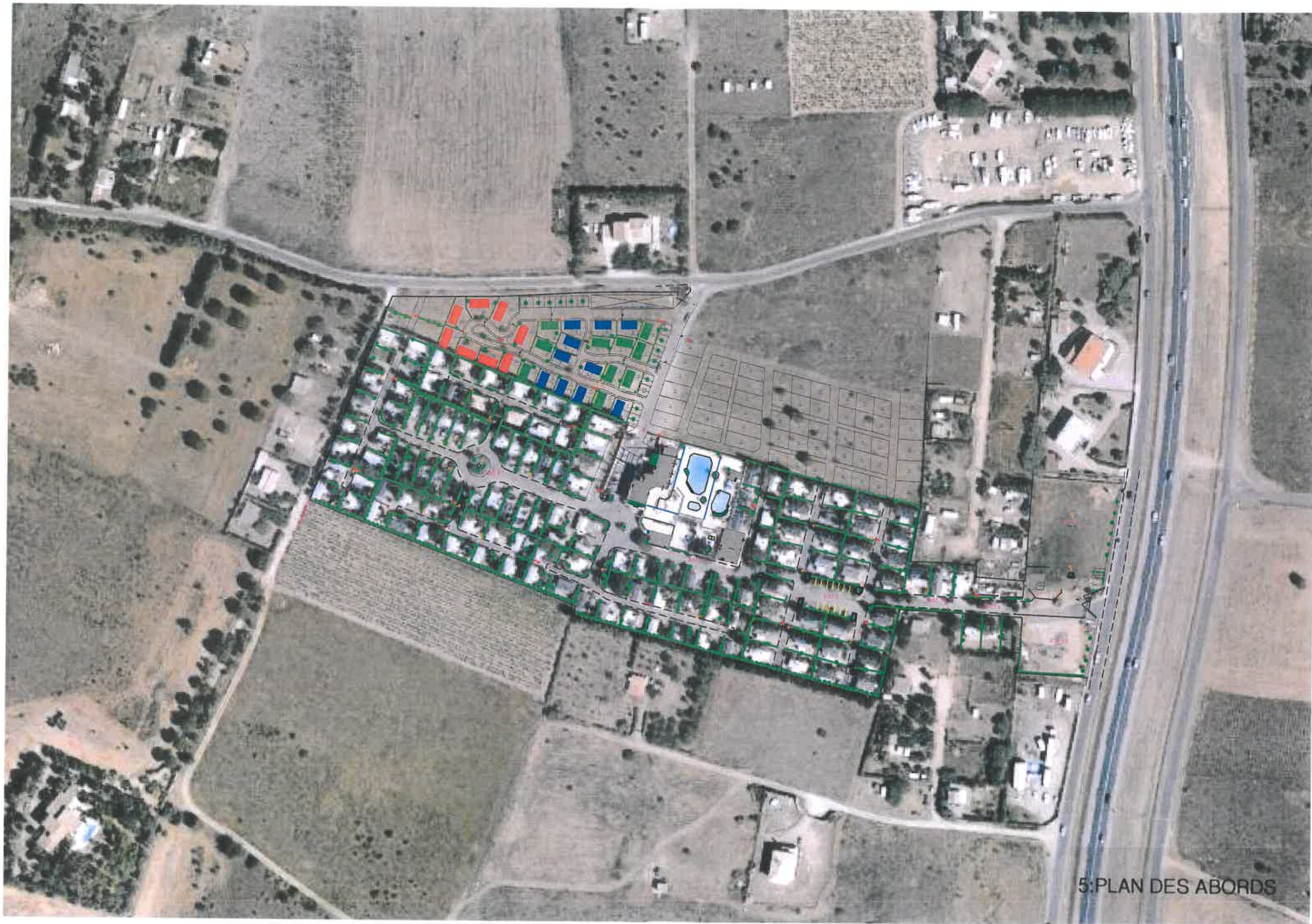
5: PLAN DES ABORDS